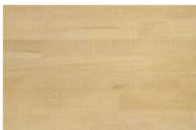
Haya Vaporizada, Clásica